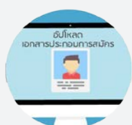
อัปโหลดเอกสารประกอบการสมัคร