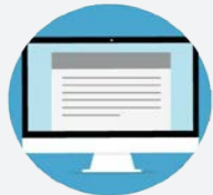
ศึกษาข้อมูลการสมัคร