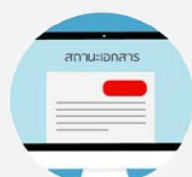
ตรวจสอบสถานะ เอกสารประกอบการสมัคร