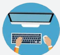
ล็อกอินเข้าสู่ระบบ เลือกเมนู “ตรวจสอบ”

ตรวจสอบสถานะเอกสารประกอบการสมัครได้ภายใน 5 วัน หลังจากการอัปโหลดเอกสารประกอบการสมัคร ผ่านระบบอินเทอร์เน็ต เว็บไซต์ http://www.msu.ac.th หรือ https://admission.msu.ac.th ให้เลือกเมนู “ตรวจสอบสถานะ” ระบบจะแสดงสถานะเอกสารประกอบการสมัคร