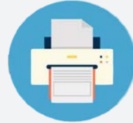
พิมพ์ใบสมัคร