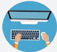
กรอกข้อมูลการสมัคร อัปโหลดรูปถ่ายดิจิทัล และบันทึกข้อมูลการสมัคร